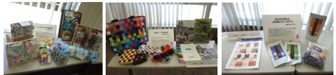
各社PRコーナーでは、試供品・見本品・パンフレット等を展示

懇親会では、歓談しながらの名刺交換なども行われておりました。またPRコーナーにご協力いただいた企業様のPRタイムが設けられ、社員の方に会社や商品などの案内をしていただきました。これまで一緒に研修を受けてきた仲間の会社や商品について、みなさんとても興味深く聞いていました。