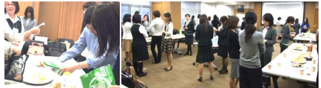
ご提供いただいた試食品を懇親会で味見